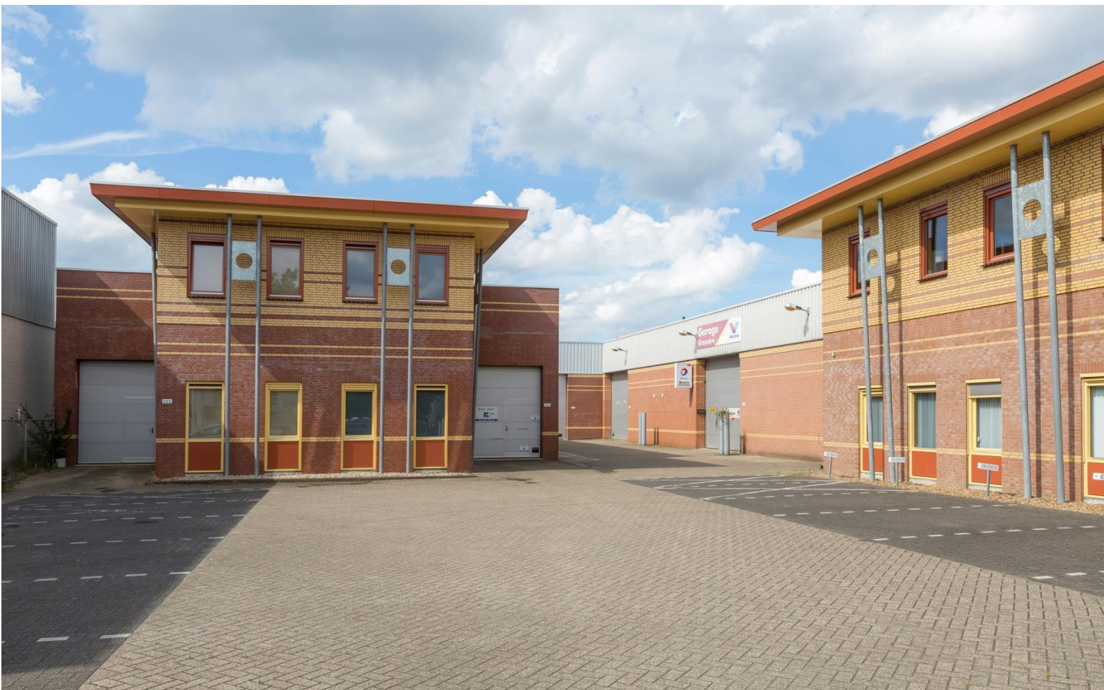
Dillenburgstraat 26 en 26B en C te Eindhoven