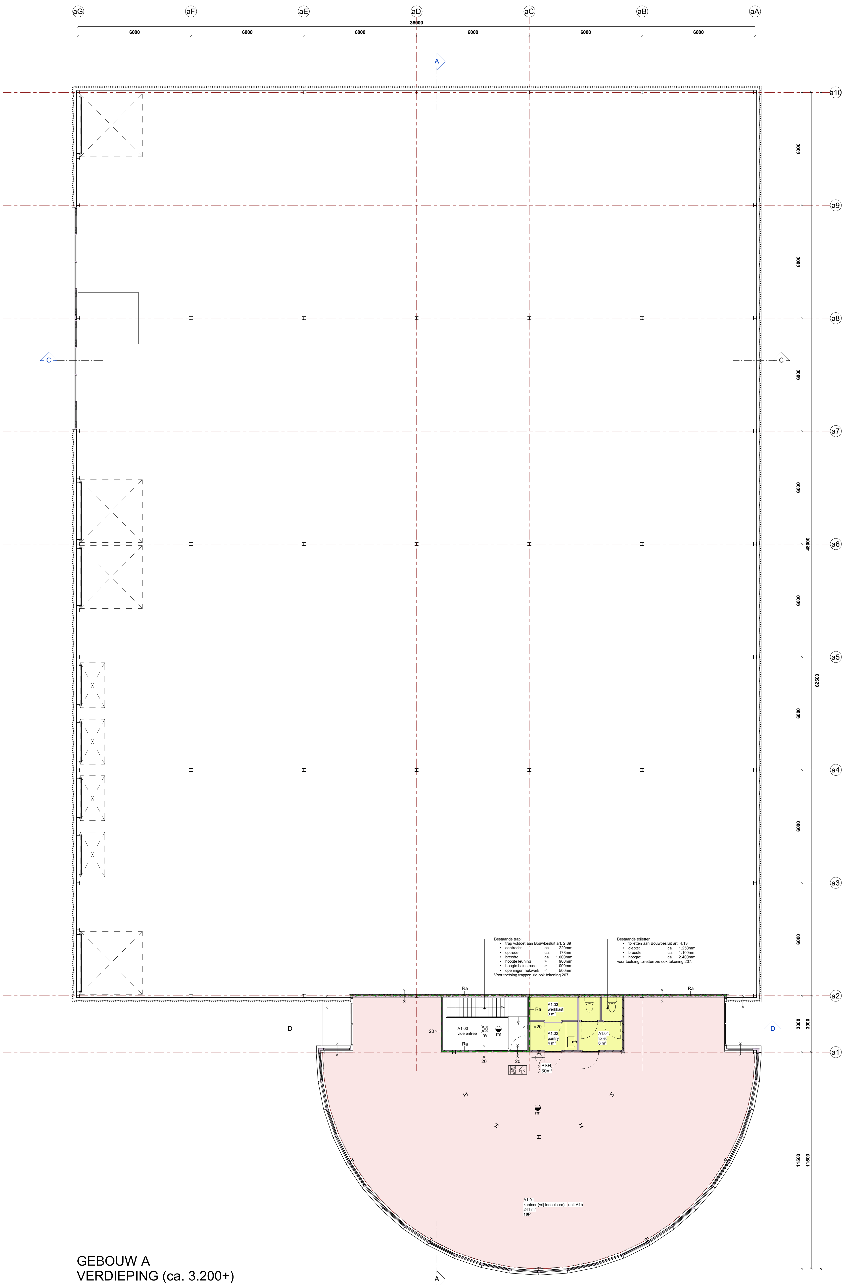
GEBOUW A VERDIEPING (ca. 3.200+)